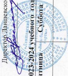
График работы кружков, спортивных секций Лаишевского детского дома на I полугодие 2023-2024 учебного года